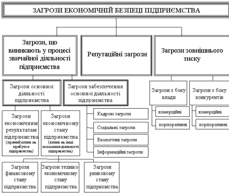
Рис. 3. Ієрархія загроз економічній безпеці підприємства

Загрози, що виникають у процесі звичайної діяльності підприємства, утворюються всередині самого підприємства та пов'язані з виробництвом і реалізацією його продукції (товарів, робіт, послуг). Вони зумовлюють зниження результативності основної діяльності підприємства та впливають на ринкову вартість бізнесу. Прикладами такого виду загроз можуть бути: низька якість організації та планування діяльності підприємства, порушення фінансової дисципліни, несвочасне погашення зобов'язань підприємства, у тому числі за виплатами працівникам, низька кваліфікація персоналу, використання техніки з високим рівнем морального та фізичного зносу тощо.