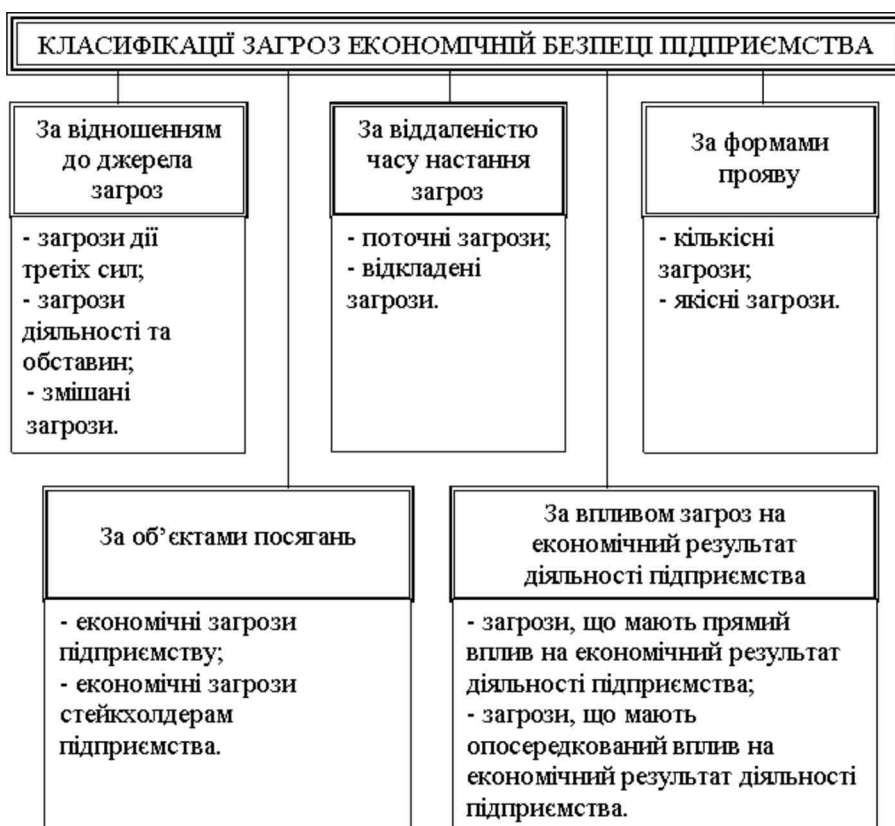
Рис. 2. Класифікація загроз економічній безпеці підприємства

Виходячи з економічної сутності категорії «загроза економічній безпеці підприємства» можна зробити висновок, що загроза має вплив на результати діяльності підприємства, тому пропонуємо класифікацію загроз за ознакою їх впливу на економічний результат діяльності підприємства. Узагальнену класифікацію загроз наведено на рис. 2.