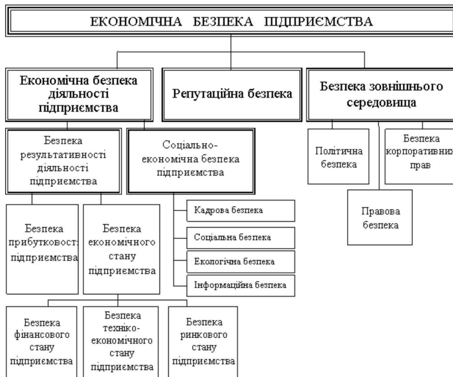
Рис. 4. Класифікація складових економічної безпеки підприємства

Висновки. Таким чином, економічна безпека підприємства включає економічну безпеку діяльності підприємства, репутаційну безпеку та безпеку зовнішнього середовища. Економічна безпека діяльності підприємства характеризує стан найбільш ефективного використання ресурсів підприємства для здійснення (реалізації) його основної діяльності, що обумовлюють забезпечення фінансової стійкості, прибутковості, платоспроможності, ділової активності та ліквідності його активів. Репутаційна безпека полягає у забезпеченні бездоганної репутації підприємства та характеризується відсутністю негативних інформаційних повідомлень про діяльність підприємства, надійність його як партнера, що забезпечує підвищення його ринкової вартості. Безпека зовнішнього середовища – це наявність найбільш сприятливих зовнішніх умов, чинників та факторів для функціонування підприємства, що знаходяться за межами підприємства та не залежать від ефективності його діяльності. Побудовані багаторівнева класифікація загроз та ієрархічна структура економічної безпеки підприємства є основою для розробки методичних підходів до комплексної оцінки економічної безпеки підприємства, як цілісної системи.