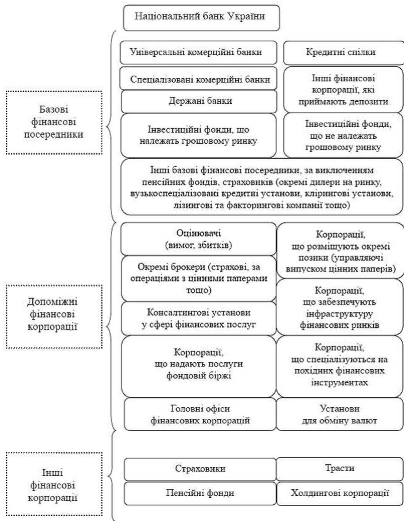
Рис. 4. Структура фінансового сектору України у відповідності до Системи національних рахунків (складено на основі [8])

Отже, у вітчизняній економіці останні десять років спостерігається явна невідповідність розвитку реального та фінансового її секторів, їх відносна несталість. Остання обумовлюється, у тому числі, й процесами трансформаційного характеру. Загальна активізація руху ФР у економіці України обумовлена світовими тенденціями. Такий рух носить в переважній мірі екстенсивний характер. Межі активізації руху ФР обумовлені, як правило, ступенем розвинутості фінансової інфраструктури. На сьогодні основним результатом функціонування такої інфраструктури є перерозподіл ресурсів переважно у бік фінансового сектору, що виступає її складовою. Це обумовлює відповідні зміни структури (насамперед інституційної) вітчизняної економіки. Наслідком останнього виступає трансформація механізму руху досліджуваних ресурсів у контексті розвитку економіки України [1;4;5].