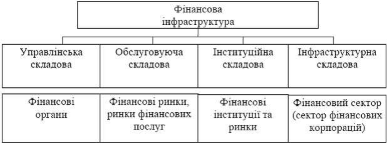
Рис. 2. Складові фінансової інфраструктури

Сучасна фінансова інфраструктура є доволі динамічною та формується, як правило, на окремих рівнях (на національному рівні їй властиві одні особливості, глобальному – інші). Складові такої інфраструктури сприяють її розростанню, що характерно для постіндустріального типу економіки [1;5]. Поряд з цим, подібне розростання найбільш явним чином відбувається на визначеній стадії розвитку постіндустріальної економіки, яка носить назву «фінансова економіка». На цій стадії виникає й більше передумов для зростання фінансових потоків, посилення їх ролі на макрорівні. Таке зростання, як відомо, має окремі наслідки (як приклад, вторинне розширення фінансової інфраструктури), зокрема негативні [6;7]. При цьому, змінюється характер руху ФР. Загалом же розвиток фінансової інфраструктури, особливо на стадії фінансової економіки, базується на ускладненні її структурних елементів, появі нових складових з метою задоволення ряду потреб [1;5].