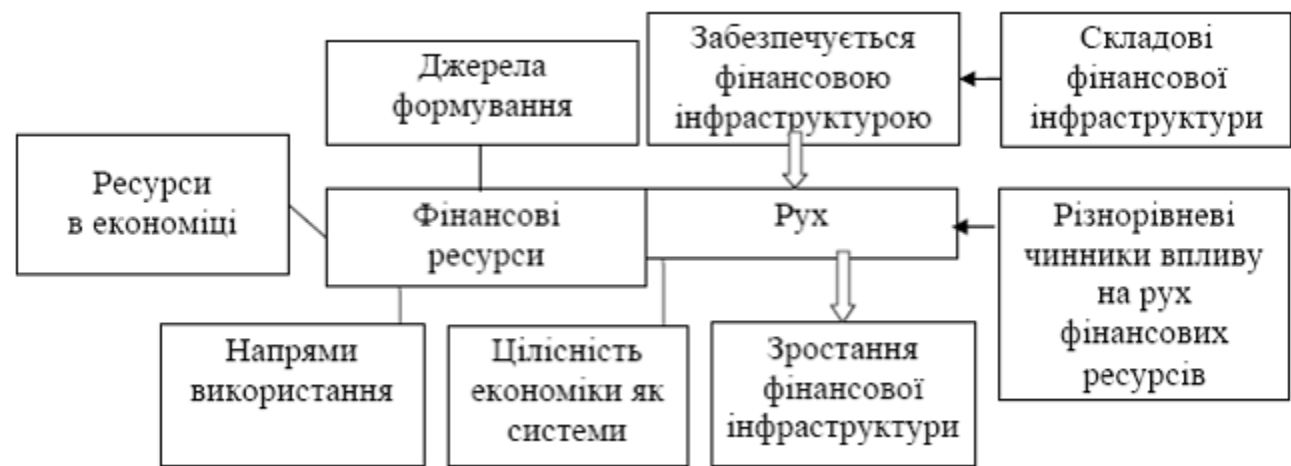
Рис. 1. Формалізація взаємозв'язків фінансової інфраструктури та руху ФР

Основні результати дослідження. Фундаментальне значення у розвитку економіки країни відіграють ФР. При цьому, важливо зосереджувати увагу й на характері та специфічних особливостях їх руху. Вивчаючи такі особливості руху ФР в економіці слід підкреслити вагому роль фінансової інфраструктури у його забезпеченні (рис. 1) [1;5].