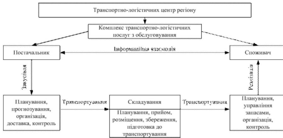
Рис. 3. Процес реалізації діяльності транспортно-логістичного центру регіону

Виходячи з функціонально-організаційної структури та з метою забезпечення оптимальності здійснення перевізного процесу, а отже й ефективності обслуговування вантажовідправників і вантажоотримувачів регіону, формування транспортно-логістичного центру регіону доцільно, на нашу думку, здійснювати з наступними етапами.