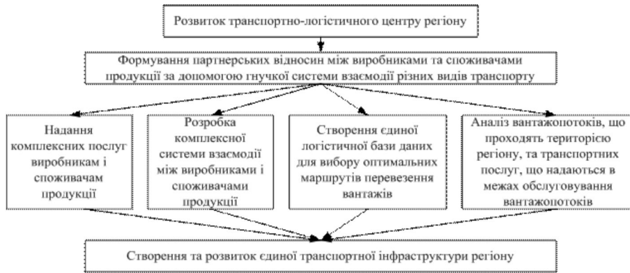
Рис. 1. Напрямки формування партнерських відносин у транспортно-логістичному центрі регіону

На сучасному етапі розвитку транспортно-економічних відносин основними завданнями створення транспортно-логістичного центру регіону виступають: - входження регіону в систему євразійських транспортних зв'язків через розвиток транзитних перевезень мережею міжнародних транспортних коридорів; - забезпечення промислових підприємств регіону якісними транспортними послугами у необхідному обсязі; - забезпечення малого і середнього бізнесу регіону якісним транспортно-логістичним сервісом.