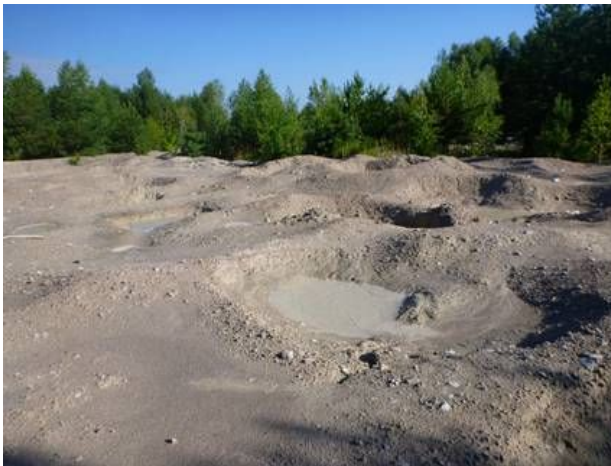
Фото 2. Волинське родовище, околиці шахти N 6.