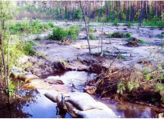
Фото 4. Наслідки нелегального видобутку бурштину. Рівненська обл. [9]

Місцеві жителі, або любителі самоцвітного каміння з інших міст та країн, які відвідують родовища дорогоцінного каміння з метою збору зразків заради продажу, поповнення власної колекції або обмінного фонду, згідно з вищезазначеним визначенням, є старателями, бо займаються пошуком і видобутком дорогоцінного каміння. Перед початком роботи, згідно із законом, їм необхідно отримати спеціальний дозвіл на користування надрами (Стаття 19 Кодекс про надра) [6]. ДСГН дає посилання на постанову Кабміну від 30.05.2011 №615 "Про затвердження Порядку надання спеціальних дозволів на користування надрами" де, на думку ДСГН, йдеться про спрощення порядку отримання дозвільних документів. Детально розглянувши цю постанову ми бачимо повну невідповідність тверджень про спрощення реальному стану. Згідно з постановою "рішення про надання дозволу без проведення аукціону приймається протягом 60 днів після надходження заяви разом із зазначеними документами у повному обсязі." (П.8)