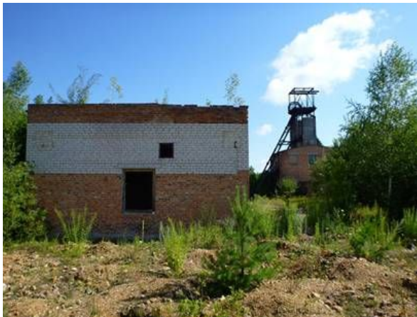
Фото 3. Волинське родовище, шахта N 2.

Схожа ситуація зараз склалася й у Рівненській області на родовищах бурштину. Державна служба геології та надр ( далі ДСГН) повідомляє : «Ситуація з видобутком та переробкою бурштину шороку погіршується. Незважаючи на зусилля правоохоронних органів продовжується несанкціонований видобуток бурштину та контрабандне вивезення його за межі держави. За оцінками правоохоронних органів нелегальний видобуток бурштину більш ніж у 5 разів перевищує видобуток державного підприємства «Бурштин України» ... (фото 4) На думку фахівців, головною причиною у затримці геологічного вивчення та підготовки перспективних родовищ на бурштин, якнайшвидшої передачі ділянок надр у користування (вирішується питання їх охорони та недопущення самовільного видобутку бурштину) є зволікання у часі при виділенні земельних ділянок під розробку чи геологічне вивчення надр органами місцевого самоврядування.» ( лист 03082012 №7050101/0412) .