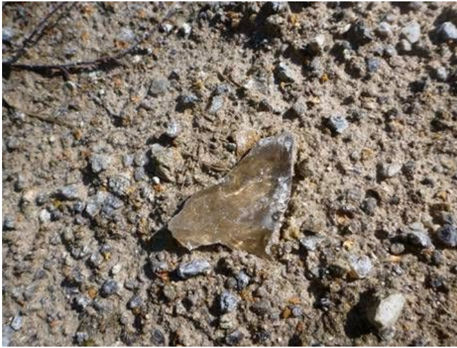
Фото 1. Волинське родовище. Димчастий кварц на відвалах біля шахти N 6.