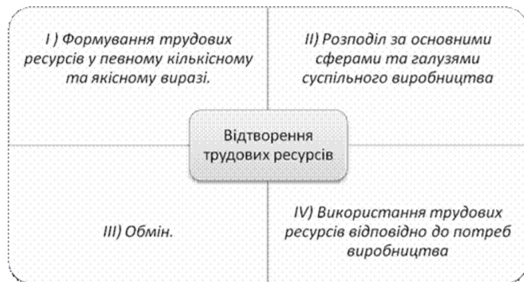
Рис. 2. Процес відтворення трудових ресурсів. Розроблено автором

З переходом до ринкових відносин виникла необхідність у поглибленому аналізі стадії обміну, оскільки його значення у відтворювальному процесі істотно зросло. Це пов'язано з підвищенням ролі ринку праці у використанні трудових ресурсів.