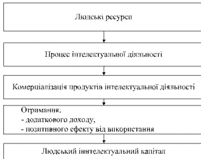
Рис 3. Етапи перетворення людських ресурсів на людський інтелектуальний капітал

Отже інтелектуальний людський капітал – це частина людських ресурсів, що здатна в процесі творчої діяльності створювати інтелектуальні продукти, інтелектуальні ресурси, інтелектуальні активи та інновації, в результаті комерціалізації яких підприємство отримає додану вартість або позитивний ефект.