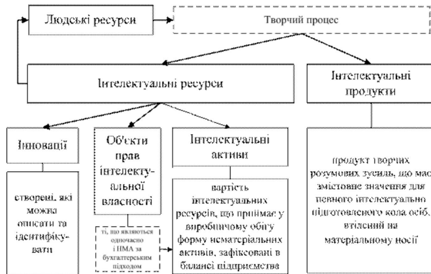
Рис. 1. Взаємозв'язок людських ресурсів, інтелектуальних ресурсів, інтелектуальних продуктів й інтелектуальних активів та їх визначення за змістом

Це дає можливість зробити висновок, що на формування інтелектуального капіталу підприємства суттєво впливають психологічні чинники. Аналіз літератури показав, що й досі відсутній єдиний підхід і чітке визначення творчого процесу як в психології так і в філософії. Приведемо декілька його визначень. Творчий процес – це різкий перехід від незнання до знання, по суті являє процес пізнавальної діяльності, що оперує ідеальними об'єктами чи моделями за допомогою логіки і інтуїції [10]. П.К. Енгельмейер під творчою активністю розуміє сукупність інтуїтивного і активного факторів [11]. А. Пуанкаре, в свою чергу, стверджує: «засобом логіки доводять, а засобом інтуїції винаходять» [10]. Доречним буде навести вислів Б.М. Кедрова [12]: «без попередньої, іноді дуже довгої та вимученої праці думки науковця та винахідника, жодна інтуїція не змогла б дати плідний результат. Інтуїція винахідника приходить в якості винагороди за плідну працю, терпіння та безупинний пошук». Якщо зовсім коротко підсумувати, то творчий процес – це поєднання логіки, інтуїції та пізнавальної діяльності.