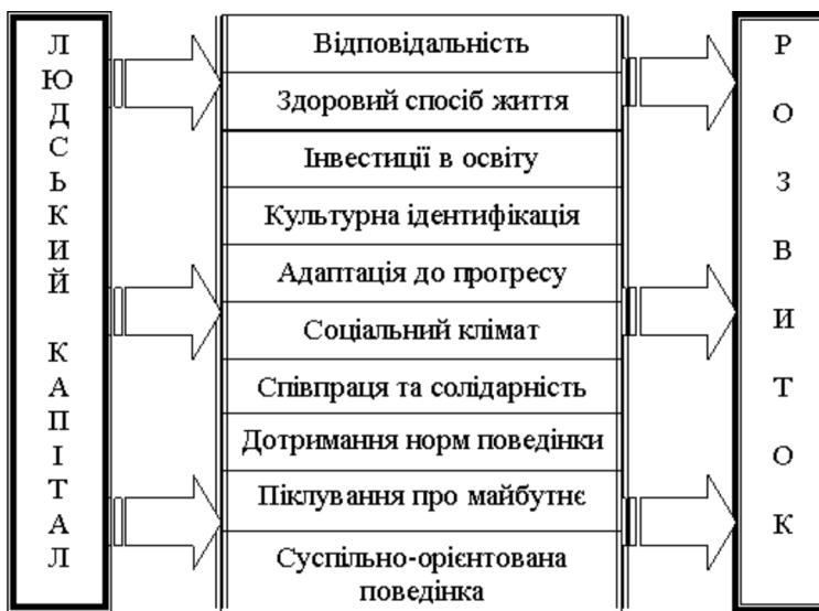
Рис. 2. Вплив людського капіталу на розвиток сільських територій

Варто зауважити, що з огляду на активізацію розвитку сільських територій, акцентуванні уваги на роль та місце громади у цьому, можна виділити групу людського капіталу громади. Науковці і практики, а особливо управлінці відзначають значну диференціацію людського капіталу різних сільських громад. Тому можна вважати, що людський капітал громад є значним ресурсом розвитку сільських територій та інституціалізації самих громад.