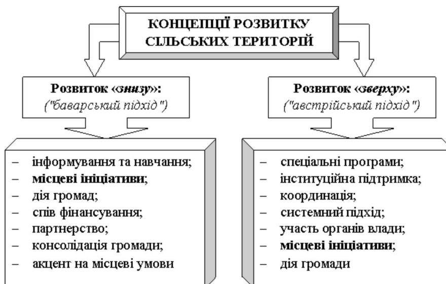
Рис. 1. Базові концепції розвитку сільських територій

До сьогодні на державному рівні в Україні не розуміли важливості підтримки місцевих ініціатив для розвитку територіальних громад. Сьогодні розроблено проект Закону «Про місцеві ініціативи» (№9404 від 03.11.2011). Документ визначає поняття місцевої ініціативи, її суб'єкта, детальний порядок внесення ініціативи та її розгляду місцевою радою. Зокрема, законопроект передбачає, що ініціативна група вносить місцеву ініціативу у формі проекту рішення місцевої ради, разом із необхідною кількістю підписів на її підтримку членів територіальної громади, до місцевої ради, де обов'язково має бути ухвалено рішення по суті внесеної ініціативи.