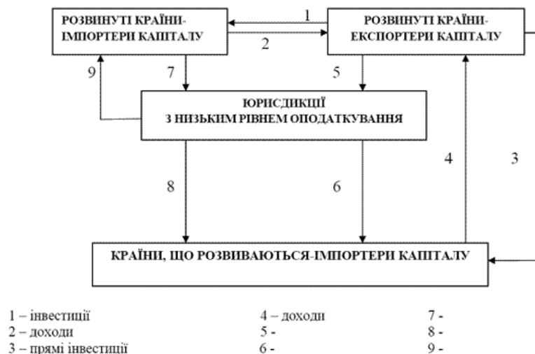
Рис. 1.1. Рух інвестиційних потоків у світовій економіці

Отже, високі податки в провідних країнах світу викликали масовий відплив інвестицій до країн з низьким рівнем оподаткування (рис. 1.1).