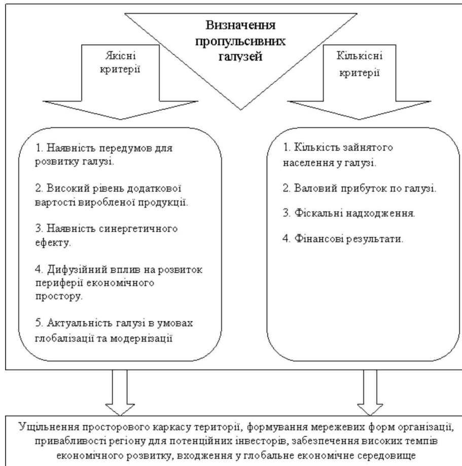
Рис. 2. Кількісні та якісні критерії ідентифікації пропульсивних галузей регіонального економічного простору

В сучасних умовах глобальних ринків суб'єктами економічної конкуренції, як правило, виступають регіональні кластери різних рівнів.