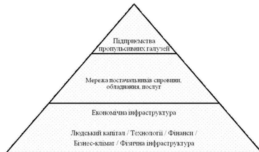
Рис. 3. Кластер

За звичай, одна або кілька компаній, що безпосередньо конкурують на регіональному, національному або глобальному ринках, відіграють лідируючу роль. Навколо них концентруються компанії – постачальники сировини, компонентів, послуг. Всі вони взаємодіють з підприємствами інфраструктури, навчальними й науковими закладами. Така система утворює кластер (рис. 3).