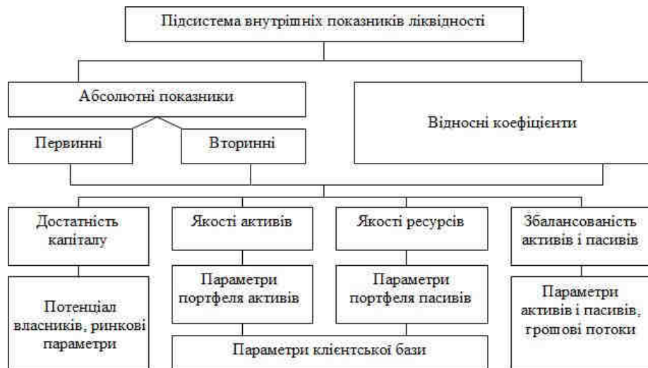
Рис. 3. Складові елементи підсистеми внутрішніх показників ліквідності [5]

Внутрішні показники ліквідності у розрізі виділених груп доцільно розподілити на підгрупи за ознакою економічної однорідності, а саме: достатності власного капіталу, якості активів та залучених ресурсів, збалансованості активів і пасивів за сумами і строками їх погашення, ризиками, вартістю, стабільністю тощо. У свою чергу підгрупи, що характеризують активи і пасиви банку, слід доповнити показниками, які б дозволяли аналізувати ліквідність однотипних портфелів активів і пасивів та синхронність грошових потоків. Такий методологічний підхід до побудови системи показників ліквідності надасть банкам можливість ефективно управляти своєю ліквідністю на основі якісного статистичного аналізу на різних рівнях.