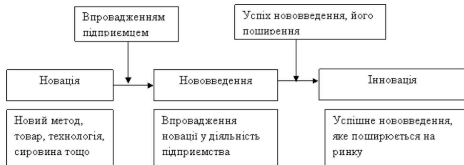
Рис. 1. Взаємозв'язок категорій «новація», «нововведення», «інновація» (авторська розробка)

нашу думку нововведення, що є успішними та поширюються на ринку, відповідають категорії «інновація»; «нововведення» - впроваджена підприємцем новація, а новація – це новий порядок, новий метод, нова технологія тощо. Так наприклад, якщо, підприємство починає використовувати у виробництві сировину, що вже існувала раніше на ринку, але не використовувалася на підприємствах певної галузі, це є нововведенням, якщо ж цю сировину починають використовувати й інші, вона стає інновацією.