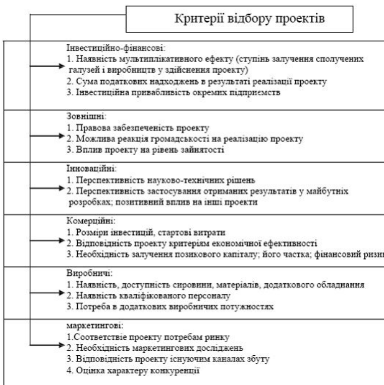
Рис. 2. Критерії відбору проектів

Реалізація запропонованого організаційно-економічного механізму (рис. 1) передбачає кілька етапів, що охоплюють всі основні функції управління (планування, організація і контроль) при здійсненні структурних змін в промисловості регіону. Одним з етапів є відбір інвестиційних проектів для фінансування, за допомогою запропонованої системи критеріїв (рис. 2).