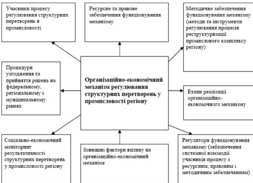
Рис. 1. Зміст організаційно-економічного механізму регулювання структурних перетворень у промисловості регіону

На рис. 1 представлена структура пропонованого організаційно економічного механізму регулювання галузевої структури промисловості регіону.