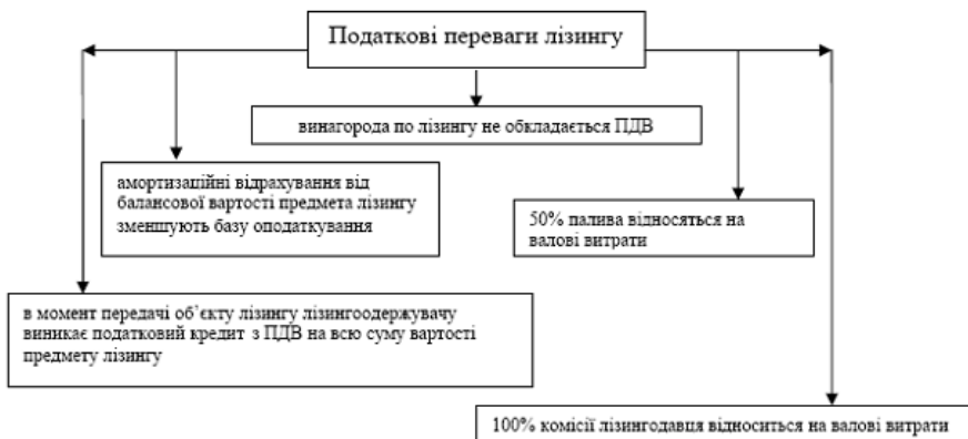
Рис. 2. Податкові переваги лізингу

Переваги лізингу стають очевидними і в економіці нашої держави. Створивши ефективну діючу лізингову систему, можна використовувати з найбільшою вигодою наявний потенціал основних фондів, та гарантувати придбання та використання сільгоспвиробниками найсучаснішого обладнання з мінімальними інвестиційними витратами.