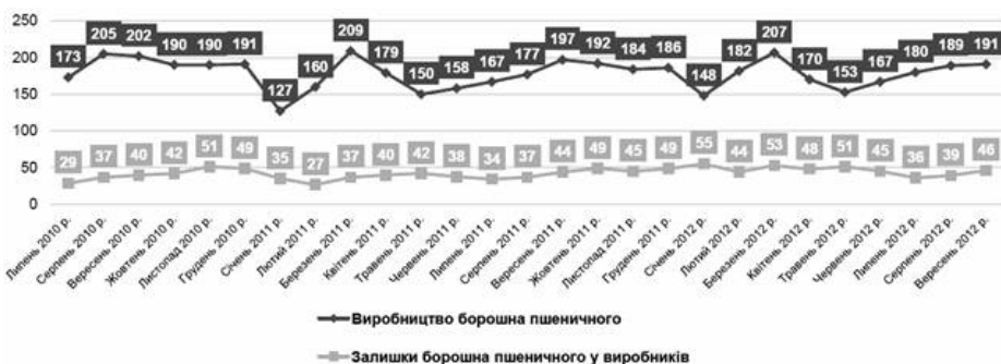
Рис. 2. Помісячна динаміка виробництва та залишків борошна пшеничного (всіх гатунків) в Україні, тис. т, 2010-2012 рр.

Як видно з рисунку 2 [7], оператори ринку відзначали, що обсяги закупівель борошна були не настільки великими, як у попередні роки, а з другої половини квітня і в травні-вересні 2012 року темпи продажів були вкрай низькими, що примушувало операторів ринку замислюватися про зупинку для дострокового проведення планових ремонтних робіт.