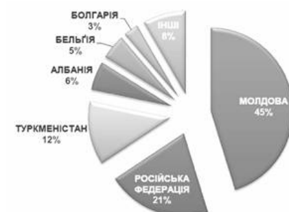
Рис. 3. Географічна структура експорту українського борошна, тис. т, січень-вересень 2012 р.

До болісної проблематики досліджуваного ринку відносять брак рухомого складу для транспортування борошна. Дана проблема була актуальною для ринку протягом всього сезону. Особливо актуальними проблеми з вагонними перевезеннями виглядали в світлі того, що основним імпортером української борошна залишалася Молдова [7]. Друге місце серед імпортерів зайняла Російська Федерація. При цьому скоротилися поставки в Ізраїль. Також суттєво зменшилися відвантаження в країни СНД. Основною причиною цього було те, що дані ринки займала російська і казахстанська мука.