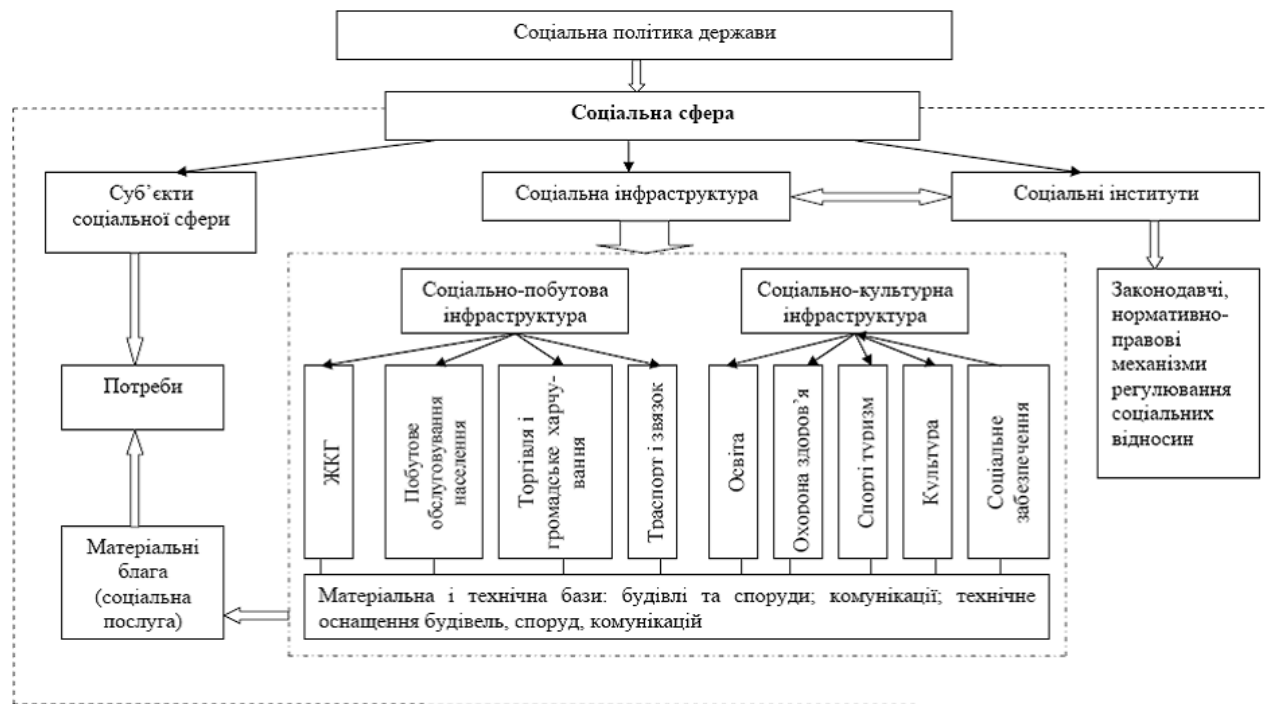
Рис. 2. Схема взаємодії складових елементів соціальної сфери

Висновки. Подальший розвиток соціальної сфери є необхідною умовою для підвищення якості життя населення. Отже доцільно в подальшому приділяти значну питаням системного підходу до формування соціальної сфери з метою більш ефективного її функціонування.