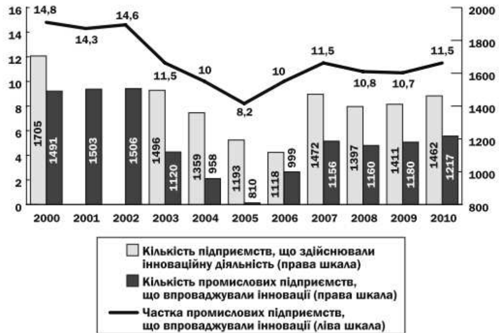
Рис. 1. Інноваційна активність промислових підприємств у 2000–2010 рр. [1, с. 45]

Так, зокрема, незважаючи на те, що в Україні за останні кілька років було прийнято значну кількість нормативно-правових актів щодо активізації інноваційно-інвестиційної діяльності як основи вирівнювання динаміки секторально-галузевих, відтворювальних, територіальних, соціальних, технологічних та інших пропорцій, показники інноваційної і інвестиційної активності все ще характеризуються значною розбалансованістю. Так, за даними статистики: ступінь зношення основних засобів у середньому по країні становить 60 %, відновлення промисловості відбувається за «сценарієм відтворення попередньої структури виробництва», у структурі реалізованої продукції переважає сировинна (69,7 % у 2011 році), а непродумана і «викривлена» структура інвестицій (скорочення програм державного інвестування, зниження показників банківського фінансування, коливання іноземного інвестування та необхідність самофінансування підприємств) спричиняє низькотехнологічну структуру виробництва. Більше того, варто говорити про стійке зниження інноваційної активності національних підприємств (рис. 1).