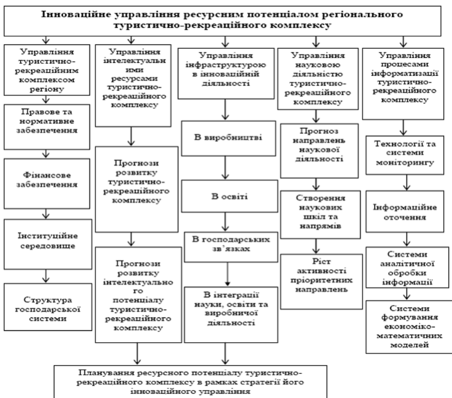
Рис. 3. Пріоритетність чинників ресурсного забезпечення і управління інноваційною активністю ТРК регіону

Після створення кластерів у рамках кожного кластера попарно порівнюються елементи за ознакою їх важливості (пріоритетності) в досліджуваному кластері (рис. 3).