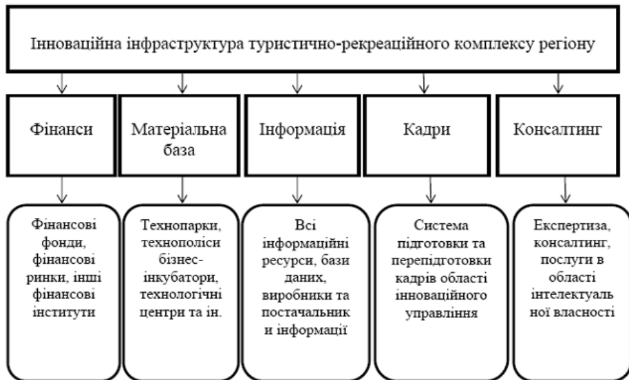
Рис. 2. Інноваційна інфраструктура сучасного регіонального туристично-рекреаційного комплексу

Ключову роль в системі інноваційного управління ресурсним потенціалом регіонального туристично-рекреаційного комплексу грає інноваційна активність її суб'єктів, яка одночасно сама чинить дію, що управляє, на систему в цілому і піддається дії (регулюванню) цієї системи. У досліджуваному нами питанні має сенс використати метод мережних зв'язків (взаємодій), ґрунтованих на декількох принципових моментах.