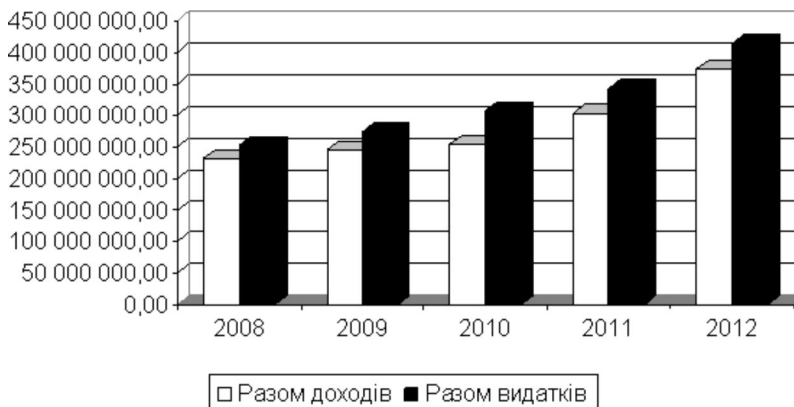
Рис. 1. Динаміка доходів та видатків державного бюджету України за період 2008-2012рр, тис.грн.

Зазначимо, що у 2009-2010рр. випереджувальними темпами зростали видатки державного бюджету, у 2011р., навпаки, швидше збільшувались доходи. Однак, у 2012р. показники росту доходів та видатків майже зрівнялись. Якщо розглянути динаміку абсолютних значень доходів та видатків державного бюджету, то ми побачимо, що протягом 2008-2012рр. видатки завжди перевищували доходи (див. рис.1).