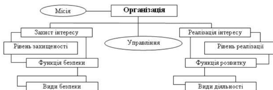
Рис. 1. Соціальна організація як об'єкт безпеки

Життєві процеси як продукти взаємодії протилежностей визначаються не тільки матеріальною структурою розглянутих об'єктів, але і їхніми найважливішими функціями – розвитку й безпеки. Ці дві функції, опосередковані інтересами, лежать в основі всіх проявів життя людини, суб'єктів господарювання, суспільства й держави.