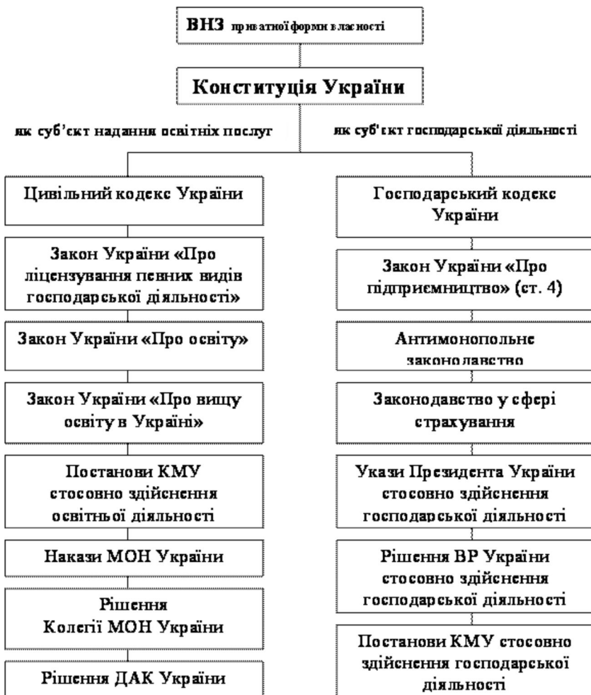
Рис. 2. Правові основи діяльності ВНЗ приватної форми власності як суб'єкту господарської та освітньої діяльності.

Крім того, ВНЗ приватної форми власності мають право виступати засновниками інших суб'єктів господарської діяльності, здійснювати відповідно Статуту інші незаборонені види господарської діяльності, а при необхідності отримувати інші ліцензії на здійснення ліцензійних видів господарської діяльності.