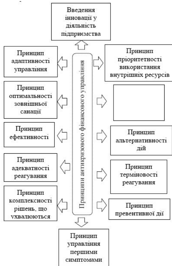
Рис. 3. Принципи антикризового фінансового управління [1]

к) принцип оптимальності зовнішньої санації визначає, що в процесі вибору форм зовнішньої санації і складу зовнішніх санаторів на стадії глибокої фінансової кризи слід виходити з системи певних критеріїв, яка розробляється в ході антикризового фінансового управління і має бути достатньою та необхідною для вчасного погашення кризи;