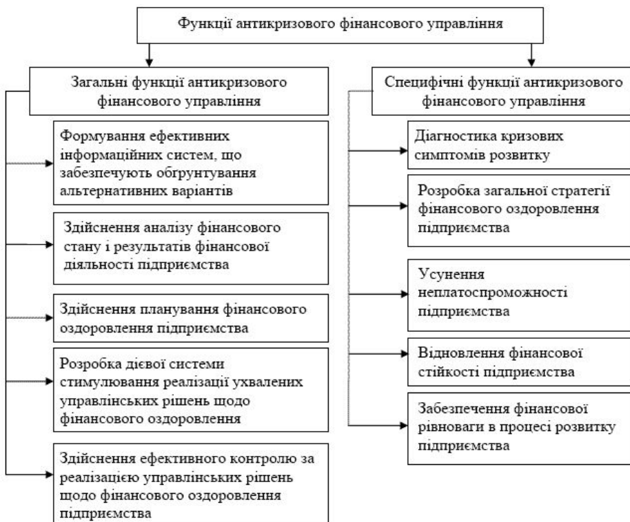
Рис. 2. Функції антикризового фінансового управління підприємством [1, с. 32]

Антикризове фінансове управління підприємством реалізує свої завдання шляхом здійснення певних функцій, наведених на рис. 2 [1, с.32].