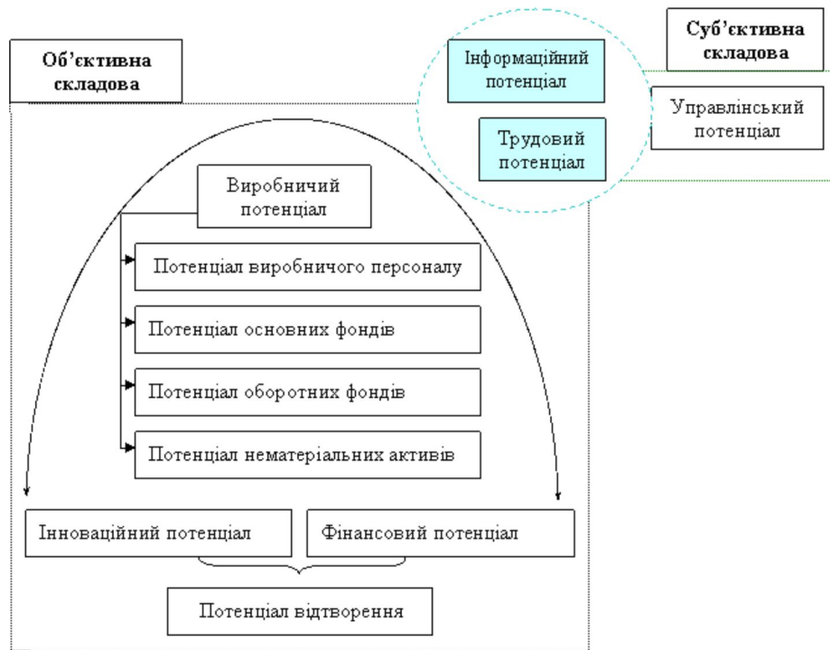
Рис.1. Структура потенціалу автотранспортного підприємства