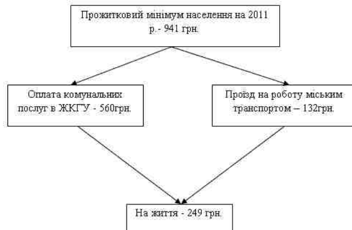
Рис. 2. Доходи та першочергові витрати працюючого пересічного громадянина в Україні за 2011 р.

Розглянемо рис.2, де зазначені доходи та першочергові витрати працюючих громадян України за 2011 рік. Так, після першочергових платежів молоде покоління, а це особи до 30 років, які мають реальну заробітну плату на 1 місяць 941 грн., можуть взимку залишити на їжу, одяг, взуття лише 249 грн. на місяць, що суперечить будь-яким нормам та встановленим в європейських країнах стандартам (табл.4), бо залишок коштів на соціальні та культурні потреби – відсутні.