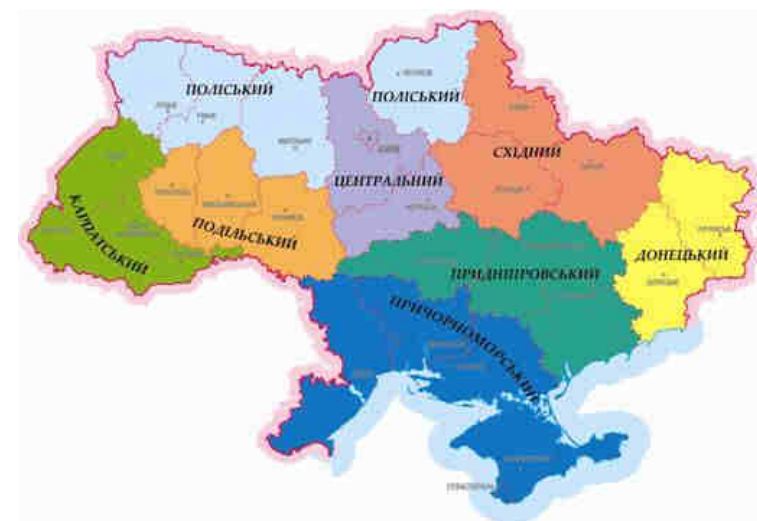
Рис. 8. Районування Гурсь В. М.

Головним недоліком даної схеми районування території України, є те, що Поліський район розірвано на дві частини Центральним районом, а це не коректно, тому що район має бути обов'язково цілісним утворенням.