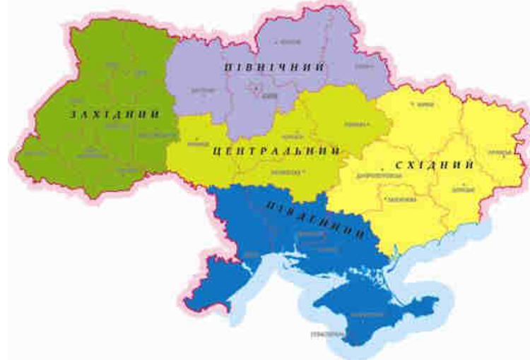
Рис. 6. Районування Баштанник В.

За аналогічним принципом В. Баштанник запропонував виділяти в Україні п'ять макрорегіонів : 1) Західний (Волинська, Закарпатська, Івано-Франківська, Львівська, Рівненська, Тернопільська, Хмельницька, Чернівецька області); 2) Північний (Житомирська, Київська, Сумська, Чернігівська області та м. Київ); 3) Південний (Автономна Республіка Крим, Миколаївська, Одеська та Херсонська області); 4) Центральний (Вінницька, Кіровоградська, Полтавська, Черкаська області); 5) Східний регіон (Дніпропетровська, Донецька, Запорізька, Луганська, Харківська області) тощо [9].