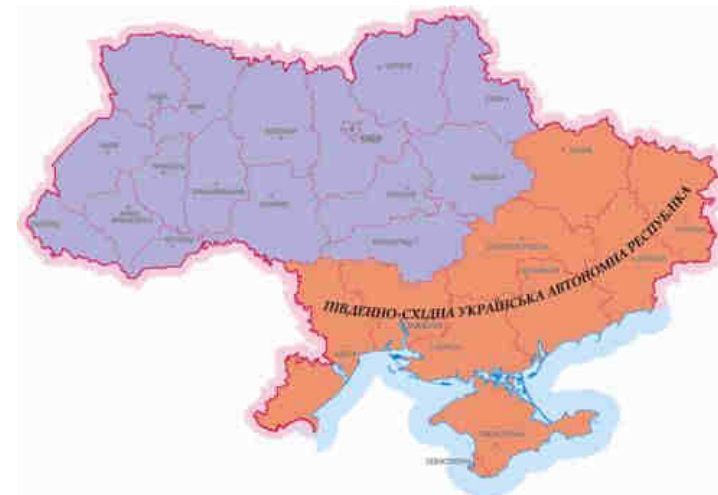
Рис. 21. Районування «Південно-Східна Українська Автономна Республіка»

Восени 2004 року керівництвом частини регіонів Південного-Сходу України було запропоновано проект автономного утворення під назвою « Південно-Східна Українська Автономна Республіка ». В основі ідеї стояла федералізація України шляхом об'єднання дев'яти областей України (Луганської, Донецької, Харківської, Дніпропетровської, Запорізької, Херсонської, Миколаївської, Одеської області й Автономної республіки Крим) у відособлену автономну республіку в складі України зі столицею в місті Харкові. Розглядалося також включення деяких інших центральних регіонів до складу автономного утворення (зокрема, Сумській області) [30].