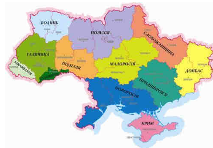
Рис. 24. Районування Медведчук В.

В липні 2012 року на конференції «Федеративна Україна» В. Медведчуком було представлено нову схему федеративного устрою яка складається з дванадцяти одиниць : 1) Закарпаття , 2) Галичина , 3) Буковина , 4) Волинь , 5) Поділля , 6) Полісся , 7) Малоросія , 8) Новоросія , 9) Придніпров'я , 10) Слобожанщина , 11) Донбас , 12) АР Крим . За його словами «федералізація країни – це єдина та безальтернативна ланка проти її розколу, загроза та реальність якого існує» [33].