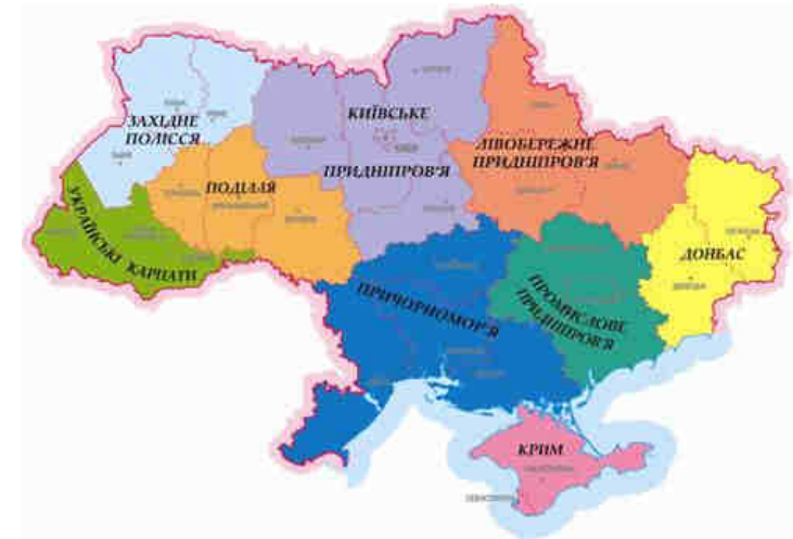
Рис. 1. Районування Маринич О.М.

Лівобережне Придніпров'я (Полтавська, Сумська, Харківська); 5) Київське Придніпров'я (Житомирська, Київська, Черкаська, Чернігівська); 6) АР Крим; 7) Західне Полісся (Волинська, Рівненська, рівнинна частина Львівської області); 8) Поділля (Вінницька, Тернопільська, Хмельницька); 9) Причорномор'я (Кіровоградська, Миколаївська, Одеська, Херсонська) [3].