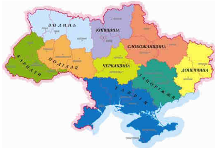
Рис. 14. Районування Експертів Міжнародного інституту порівняльного аналізу