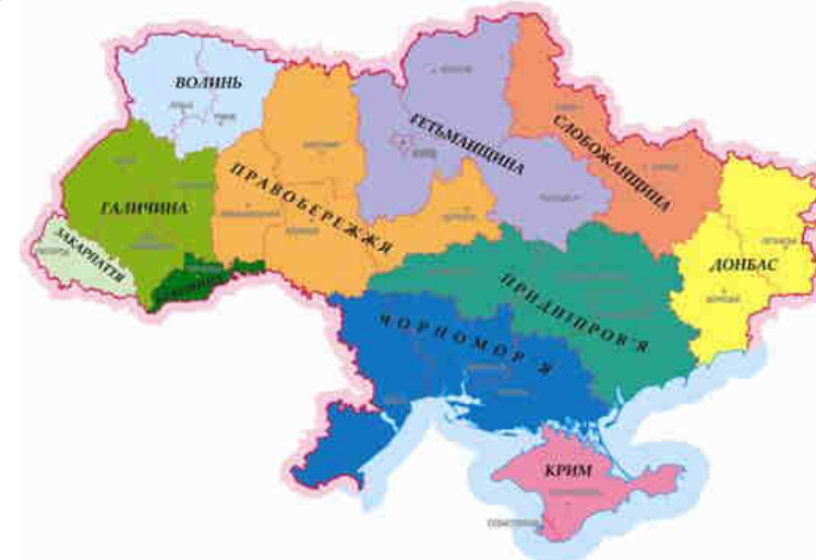
Рис. 18. Районування Мельник І.

За проектом І. Мельник в основу адміністративно-територіального устрою необхідно покласти одинадцять земель з досить широкими правами в галузі самоврядування, які виникли історично і мали приблизно однаковий склад населення: 1) Волинь (Волинська та Рівненська області); 2) Галичина (Львівська, Тернопільська, Івано-Франківська області); 3) Закарпаття (Закарпатська область); 4) Буковина (Чернівецька область); 5) Правобережжя (Житомирська, Вінницька, Хмельницька, Черкаська області); 6) Гетьманщина (Київська, Чернігівська, Полтавська області); 7) Слобожанщина (Харківська та Сумська області); 8) Донбас (Донецька та Луганська області); 9) Придніпров'я (Дніпропетровська, Запорізька, Кіровоградська області); 10) Чорномор'я (Одеська, Миколаївська та Херсонська області); 11. Крим (Автономна республіка Крим) [25].