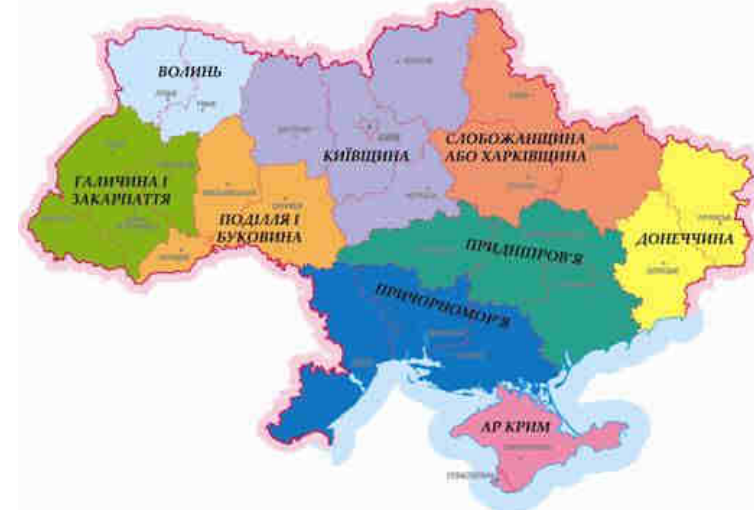
Рис. 4. Районування Паламарчук М. М.

В 1994 р. М.М. Паламарчук розробив проект схеми районування з поділом України на дев'ять районів: 1) Донецчина (Донецька, Луганська); 2) Придніпров'я (Дніпропетровська, Запорізька, Кіровоградська); 3) Слобожанщина або Харківщина (Харківська, Сумська, Полтавська); 4) Київщина (Київська, Житомирська, Чернігівська, Черкаська); 5) Галичина і Закарпаття (Львівська, Івано-Франківська, Закарпатська, Тернопільська); 6) Поділля і Буковина (Вінницька, Хмельницька, Чернівецька); 7) Волинь (Волинська, Рівненська); 8) Причорномор'я (Миколаївська, Одеська, Херсонська); 9) АР Крим .