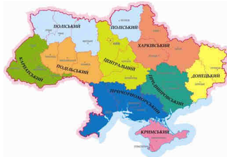
Рис. 11. Районування Симоненко В. К.

Симоненком В.К. у 1996 році було запропоновано поділити територію України на дев'ять районів: 1) Центральний (Київська, Кіровоградська, Черкаська); 2) Придніпровський (Дніпропетровська, Запорізька); 3) Донецький (Донецька та Луганська області); 4) Харківський (Харківська, Полтавська, Сумська); 5) Подільський (Вінницька, Тернопільська, Хмельницька); 6) Поліський (Волинська, Рівненська, Житомирська, Чернігівська); 7) Кримський (АР Крим); 8) Карпатський (Львівська, Івано-Франківська, Закарпатська, Чернівецька); 9) Причорноморський (Одеська, миколаївська, Херсонська) [16].