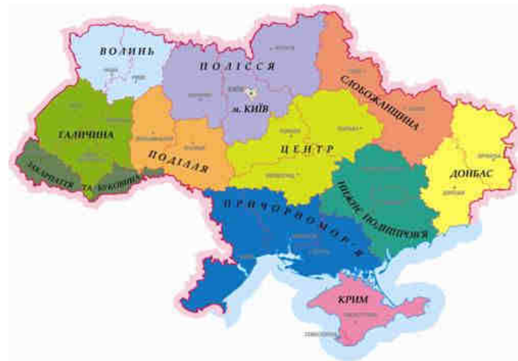
Рис. 17. Районування Колодій А.