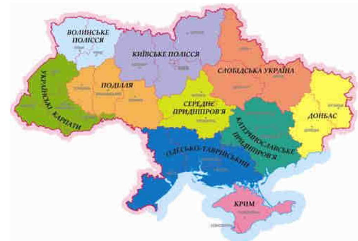
Рис. 2. Районування Поповкін В.А.

Також на початку 1990-х рр. проблемою економічного районування України займався Національний інститут стратегічних досліджень під керівництвом професора В.А. Поповкіна . Вчені виділили п'ять внутрішньо-республіканських макрорайонів: 1) Центрально-Український; 2) Донбас і Придніпров'я; 3) Слобідська Україна; 4) Причорноморський; 5) Західноукраїнський. Цей поділ враховував природні, економічні, соціально-демографічні та історико-етнічні умови і фактори, які так чи інакше впливають на регіональне районування. Вчений вважав, що мережа макро- і мезорайонів сприяла б регулюванню основних економічних пропорцій, вдосконаленню територіального поділу праці, слугувала б науково-аналітичним та прогностичним цілям.