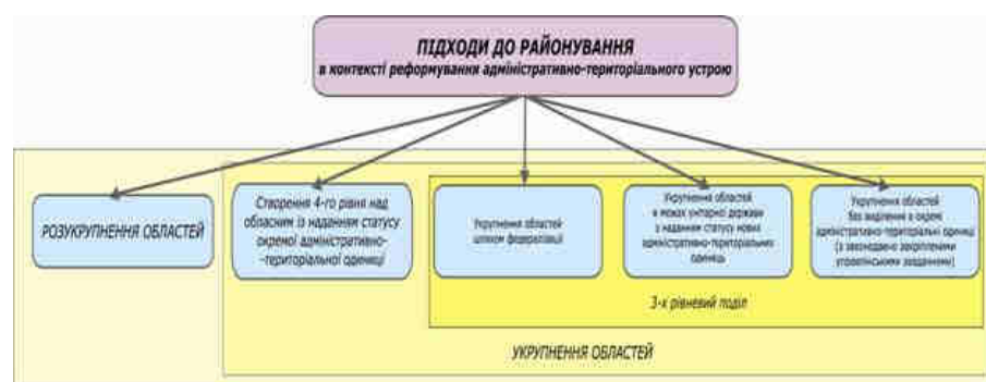
Рис. 25. Підходи до районування в контексті реформування адміністративно-територіального устрою

Підсумовуючи думки науковців можна зробити певні висновки, про те, що існують два основні підходи до районування території України в контексті реформування адміністративно-територіального устрою – укрупнення, тобто зменшення кількості областей та формування на їх основі більших за розмірами районів та розукрупнення областей (рис. 25).