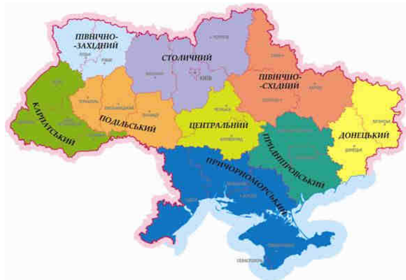
Рис. 10. Районування Масляк П. О., Шищенко П. Г.