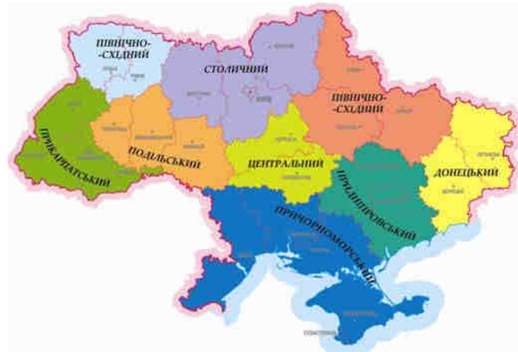
Рис. 7. Районування Пістун М. Д.

Професор М. Д. Пістун поділяє Україну на дев'ять суспільно-географічних районів : 1) Столицький (Київський) у складі Київської, Житомирської та Чернігівської областей; 2) Центральний – Черкаська та Кіровоградська області; 3) Північно-Східний – Харківська, Полтавська, Сумська області; 4) Донецький – Донецька та Луганська області; 5) Придніпровський – Дніпропетровська та Запорізька області; 6) Причорноморський – Автономна республіка Крим (АРК), Одеська, Миколаївська та Херсонська області; 7) Подільський – Вінницька, Тернопільська та Хмельницька області; 8) Прикарпатський – Львівська, Івано-Франківська, Закарпатська та Чернівецька області; 9) Північно-Східний – Волинська та Рівненська області.