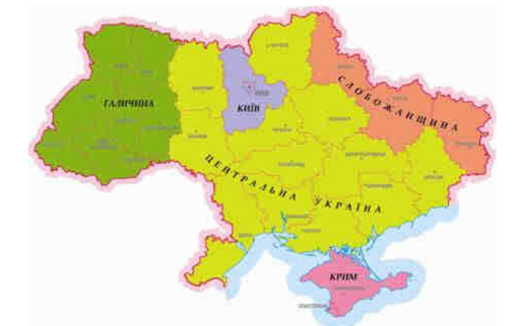
Рис. 23. Районування Тихонов В.

В травні 2010 року було представлено варіант схеми федералізації України запропонований В. Тихоновим, в результаті чого пропонувалося розділи територію на п'ять частин: 1) Галичина, 2) Центральна Україна, 3) Київ, 4) Слобожанщина та 5) АР Крим.