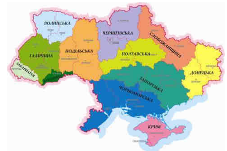
Рис. 22. Районування Коптів Д.

Д. Коптів пропонує розглядати територіальний устрій з точки зору майбутньої Федеративної Республіки Україна, з виділенням більш крупних утворень – земель. Згідно з думкою автора федерація буде складатися з дванадцяти федеральних земель: 1) Буковина (Чернівецька область; столиця – Чернівці); 2) Волинська земля (Рівненська, Волинська області; столиця – Рівне); 3) Галичина (Львівська, Тернопільська, Станіславівська, столиця – Львів); 4) Донецька земля (Донецька, Луганська області; столиця – Донецьк); 5) Закарпаття (Закарпатська область; столиця – Ужгород); 6) Запорізька земля (Запорізька, Дніпропетровська, НовоГардська області; столиця – Дніпро); 7) Чернігівська земля (Київська, Чернігівська, столиця – Чернігів); 8) Крим (АР Крим включаючи Севастополь; столиця – Сімферополь); 9) Подільська земля (Вінницька, Хмельницька, Житомирська; столиця – Вінниця); 10) Полтавська земля (Черкаська, Полтавська, столиця – Черкаси); 11) Слобожанщина (Сумська, Харківська області; столиця – Харків); 12) Чорноморська земля (Одеська, Миколаївська, Херсонська області, можливо частина колишньої Молдавської АРСР – Придністров'я; столиця – Миколаїв (у випадку іншого вибору Одеси)). До федеральних міст автор відносить міста Київ (столиця Федерації) і, можливо, Одеса (місто з правами «порто-франко»), що підпорядковані власним законам управління, утвердженим на рівні федерації. Федеральні землі і федеральні міста є рівноправними учасниками Федерації з однаковою кількістю голосів [32].