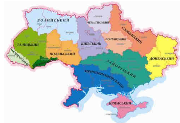
Рис. 16. Районування Немченко Л.