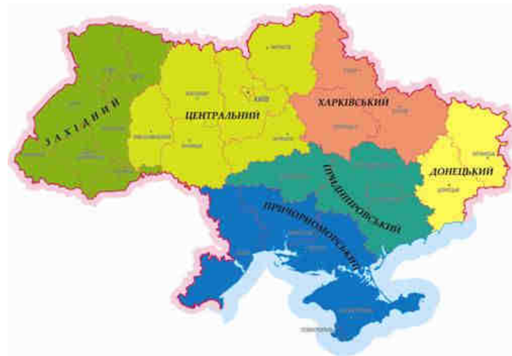
Рис. 13. Районування Долишній М. І., Паламарчук М. М. та Паламарчук О. М.