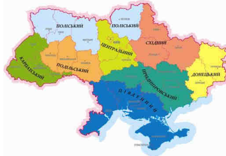
Рис. 12. Районування Ради по вивченню продуктивних сил України НАН України

У 90-ті роки ХХ-го століття були проведені розробки з економічного районування провідними вченими Ради по вивченню продуктивних сил України НАН України . Здобутки цих досліджень у 1998 році були внесені в проект Закону України «Про Концепцію державної регіональної економічної політики». Вони включали поділ території України на вісім економічних районів: 1) Карпатський (Закарпатська, Івано-Франківська, Львівська, Чернівецька області); 2) Подільський (Вінницька, Тернопільська, Хмельницька області); 3) Поліський (Волинська, Житомирська, Рівненська, Чернігівська області); 4) Східний (Полтавська, Сумська, Харківська області); 5) Донецький (Донецька, Луганська області); 6) Придніпровський (Дніпропетровська, Запорізька, Кіровоградська області); 7) Центральний (Київська, м. Київ, Черкаси); 8) Південний (Миколаївська, Одеська, Херсонська, АР Крим, м. Севастополь).