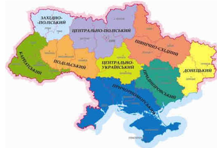
Рис. 3. Районування Заставний Ф. Д.