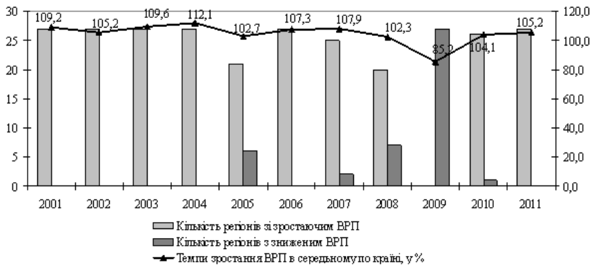
Рис. 1. Співвідношення регіонів України зі зростаючим і спадаючим темпом зростання валового регіонального продукту за 2001 - 2011 рр.

Примітка: складено та розраховано за даними [3-7]