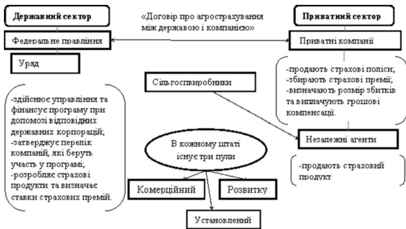
Рис. 2. Система агрострахування в США

Примітка. Складено на основі вивчених джерел