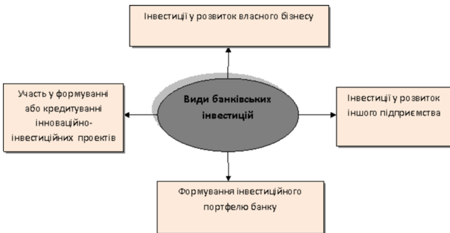
Рис. 1. Інвестиційна діяльність банків та її види

Згідно з чинним законодавством України, інвестиційна діяльність банків охоплює (рис 1):