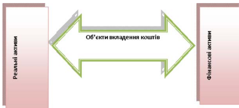
Рис. 2. Основні форми інвестиційної діяльності комерційних банків

Класифікація форм інвестиційної діяльності комерційних банків в сучасній літературі та банківській практиці здійснюється на основі загальних критеріїв систематизації форм і видів інвестицій, але в той же час має деякі особливості враховуючи специфіку банківської діяльності. Як вже згадувалось, відповідно до об'єкту вкладення коштів можна виділити вкладення в реальні економічні активи (реальні інвестиції) і вкладення у фінансові активи (фінансові інвестиції), що наочно представлені на рис 2.