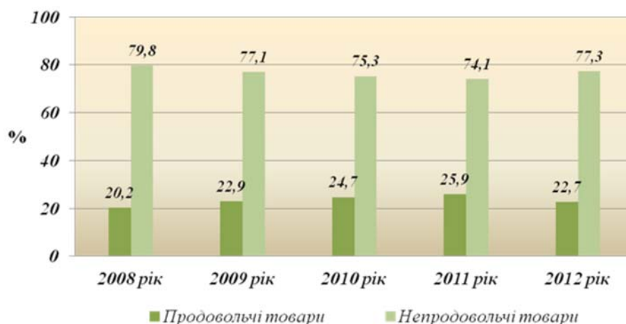
Рис. 2. Структура обсягу товарних запасів України за 2008 – 2012 роки

Відповідно до даних табл. 4, можна визначити, що в досліджуваному періоді відбулося зростання суми товарних запасів, як продовольчих так і непродовольчих товарів. Запаси продовольчих товарів за період зросли в 1,8 разів і станом на 1 січня 2013 року становили 9260 млн. грн., а сума непродовольчих товарів зростала порівняно меншими темпами і за даний період зросла в 1,5 разів, і на початок 2013 року становила 31468 млн. грн. Товарна структура запасів станом на 1 січня 2013 року становить: 22,7% - продовольчі товари і 77,3% - непродовольчі товари. Отже, можна констатувати, що на невіправданий приріст товарних запасів в головному вплинуло суттєве збільшення обсягу продовольчих товарів з 5189 млн. грн. у 2008 році до 9260 млн. грн. у 2012 році. Збільшення обсягу непродовольчих товарів теж негативно вплинуло на загальний приріст товарних запасів, їх збільшення відбулося з 20514 млн. грн. у 2008 році до 31468 млн. грн. у 2012 році. Структура обсягу товарних запасів України за 2008 – 2012 роки представлена на рис. 2.