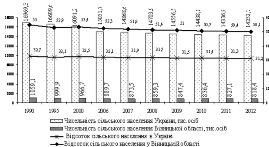
Рис. 1. Чисельність наявного сільського населення та частка його в загальній чисельності населення за 1990-2012 рр.

Статистика свідчить, що чисельність наявного сільського населення України за період з 1990 по 2012 роки скоротилася на 16 %, за період з 2006 по 2012 роки – на 5 %. Середній спад у Вінницькій області, яка споконвіку є аграрною, за останні шість років становив 133,1 тис. осіб, а чисельність сільського населення з 1990 по 2012 рр. скоротилася на 23 %, за останні шість років – на 8 %. У середньому щорічно у 2006-2012 рр. кількість сільських жителів зменшувалася на 11,8 тис. осіб (рис. 1). Це відбувається, насамперед, через збільшення смертності, зменшення народжуваності, міграцію працездатного населення.