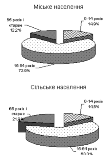
Рис. 2. Розподіл населення за віковими групами станом на 1.01.2012 р. по Вінницькій області

Варто відзначити, що за віковими категоріями структура постійного міського й сільського населення в області відрізняється. Так, у місті частка працездатного населення станом на 1 січня 2012 року становила 72,9 %, діти віком до 14 років – майже 15%, на населення віком 65 років і старше припадало 12,2%, тоді як на сільській території на ті ж вікові групи припадало відповідно 63,3 %, 14,8% і 21,9 % (рис. 2) Працездатне населення області в більшій мірі зосереджене в місті, тоді як пенсіонери – в селі.