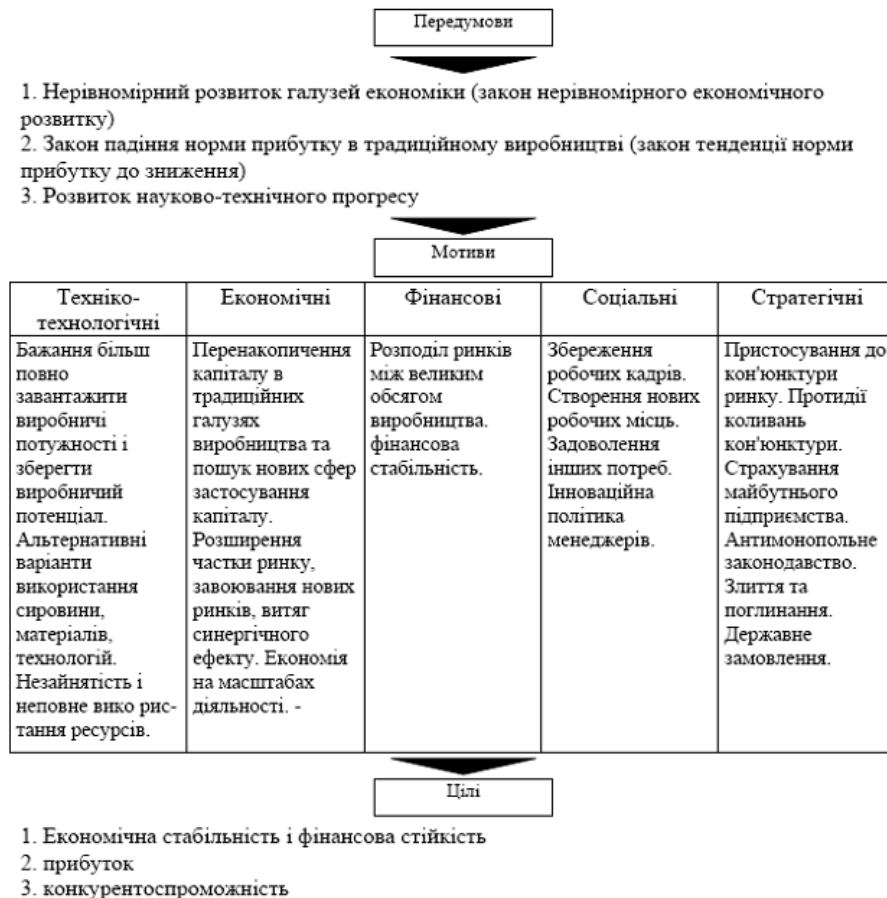
Рис. 2. Мотиви і цілі диверсифікації

Кожен наступний етап був кроком у досягненні власних цілей виробництва і відрізнявся зміною стратегічних пріоритетів у розвитку підприємницької діяльності. Як показав аналіз сучасних світових тенденцій диверсифікації, існує ряд мотивів і цілей, які найбільш часто служать стимулами для розширення масштабів діяльності, що показано на рис. 2.