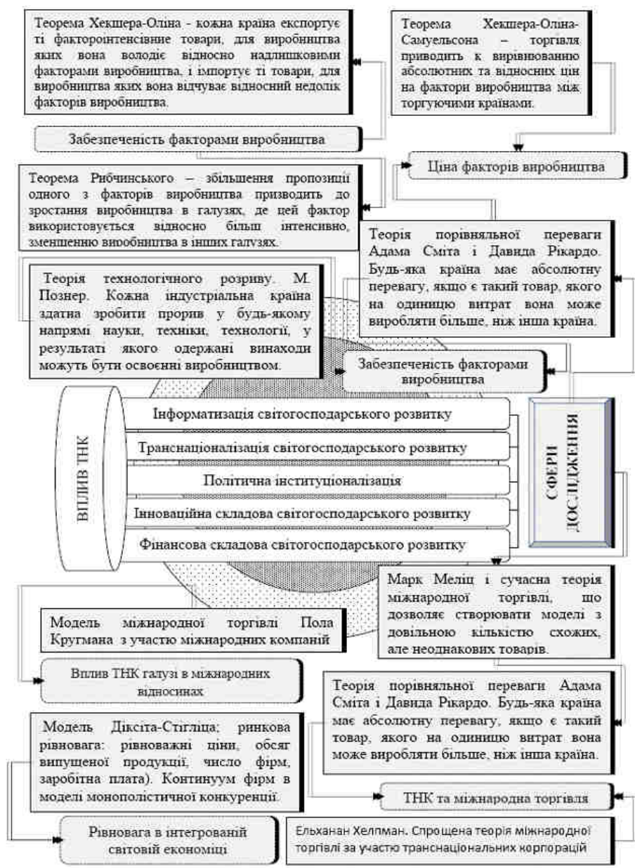
Рис. 2. Корпоративна модифікація теорій сприяння розвитку зовнішньоекономічної діяльності підприємств в умовах глобалізації [4,2,7,11]

Новітні підходи, що з'явилися під впливом наведених у рисунку 2. складових світогосподарського розвитку дозволяють виявляти і аналізувати наслідки тих ситуацій, в яких підприємства знаходять вигідним ставати транснаціональними. Ці корпорації є чітко визначеними економічними суб'єктами, вони володіють специфічними активами, беруть участь в монополістичній конкуренції і грають активну роль у зовнішньоекономічній діяльності. Новітні концепції сприяння розвитку зовнішньоекономічної діяльності підприємств в умовах глобалізації на відміну від класичних пояснюють одночасне існування міжсекторальної, внутрішньогалузевої та внутрішньофірмової торгівлі. Проте, незважаючи на відносне багатство даних теорій, вони потребують подальшого розширення і уточнення з тим, щоб охопити широкий спектр новітніх проблем зовнішньоекономічної діяльності. Також слід підкреслити, що в вище зазначених концепціях не були отримані більш реалістичні структури торгівлі, за своїм фундаментальним властивостям, вони не відрізняються від тих структур торгівлі, які були виведені в більш ранніх теоріях [2].