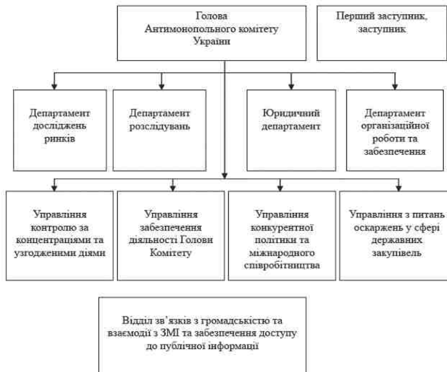
Рис. 1. Структура Антимонопольного комітету України

Важливим принципом стосовно конкурентної політики, а саме здійснення державного контролю за антимонопольно-конкурентною політикою. Державному контролю за антимонопольно-конкурентною політикою притаманні певні ознаки, які відрізняють цей різновид контролю від інших його видів. Такими ознаками є: суб'єкти, уповноважені здійснювати контроль; об'єкт; мета контролю. Ніхто не відмовляється від того, що антимонопольно-конкурентна політика є формою державного регулювання. В нормах чинного законодавства відсутня належним чином урегульоване питання самої антимонопольно-конкурентної політики. Відсутність законодавчо закріпленого визначення зазначеної політики призводить до ускладнень із розумінням її змісту й інших негативних наслідків, що зумовлено прогалинами у законодавстві.