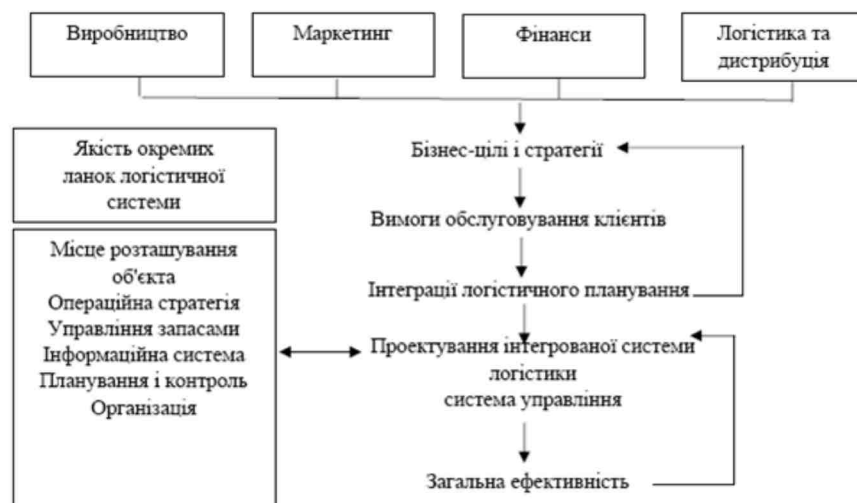
Рис. 2. Формування стратегічної логістичної моделі*

II. Етап розробки організаційної системи логістичної мережі. Вибір варіанту організаційної структури служби (відділу) логістики фірми, а також вирішення питання про її можливий реінжиніринг є обов'язковими елементами логістичної стратегії.