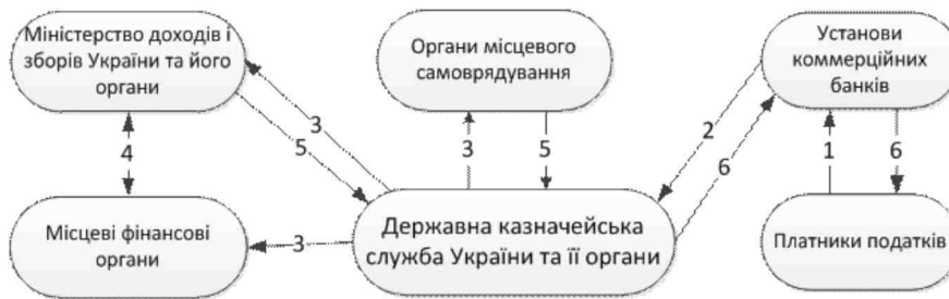
Рис. 1. Процес казначейського обслуговування державного бюджету за доходами

Порядок повернення коштів, помилково або надміру зарахованих до державного бюджету, та порядки взаємодії органів Казначейства з органами, що згідно законодавством контролюють справляння надходжень бюджету, регламентуються окремими нормативно-правовими актами [4].