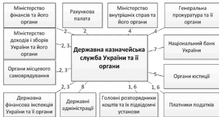
Рис. 3. Взаємодія органів Державної казначейської служби України в процесі казначейського обслуговування державного бюджету за доходами з іншими учасниками бюджетного процесу

Органи Казначейства України відповідно до вимог ст.112 Бюджетного кодексу України та Положення про Державну казначейську службу України в проєкті казначейського обслуговування державного бюджету за доходами здійснюють контрольні функції ( попередній та поточний контроль), а саме: