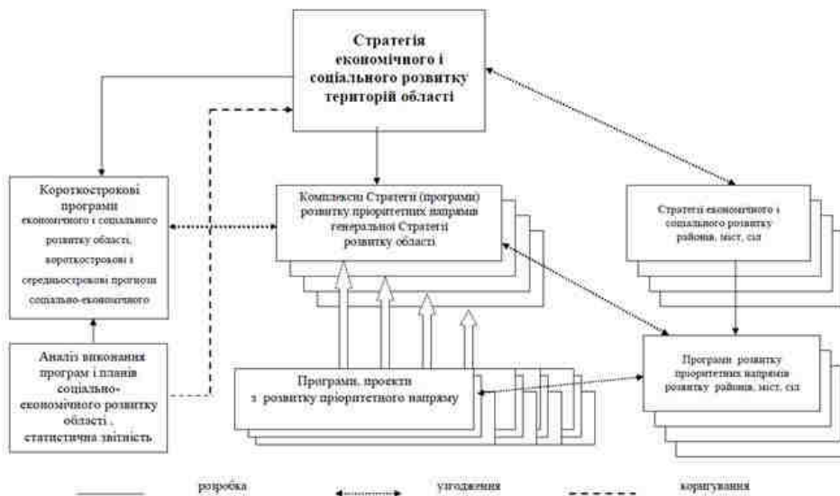
Рис. 3. Структурна модель реалізації стратегії економічного і соціального розвитку регіону

Управління процесом реалізації стратегії економічного і соціального розвитку території області рекомендується здійснювати на двох рівнях у сфері загального управління стратегією і управління за стратегічними напрямками.