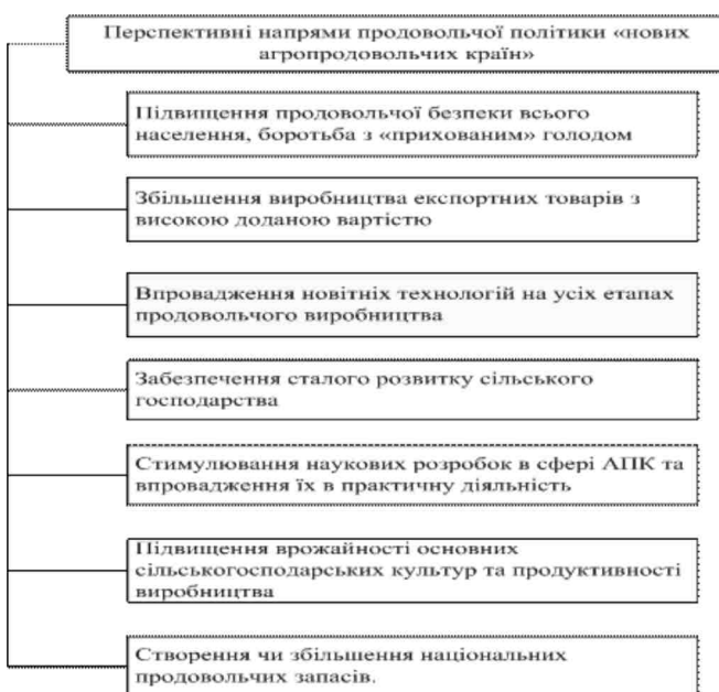
Рис. 1. Загальні перспективні напрями продовольчої політики «нових агропродовольчих країн»

Всі «нові агропродовольчі» країни мають свої особливості, проблемні питання у продовольчій політиці, саме тому кожна з них потребує уточнення напрямів її вдосконалення для подальшого входження на світовий ринок агропродовольчої продукції та забезпечення повноцінного харчування свого населення. На нашу думку, доцільно буде запропонувати загальні перспективні напрями продовольчої політики для всіх «нових агропродовольчих» країн (рисунк 1), так і для кожної окремо.