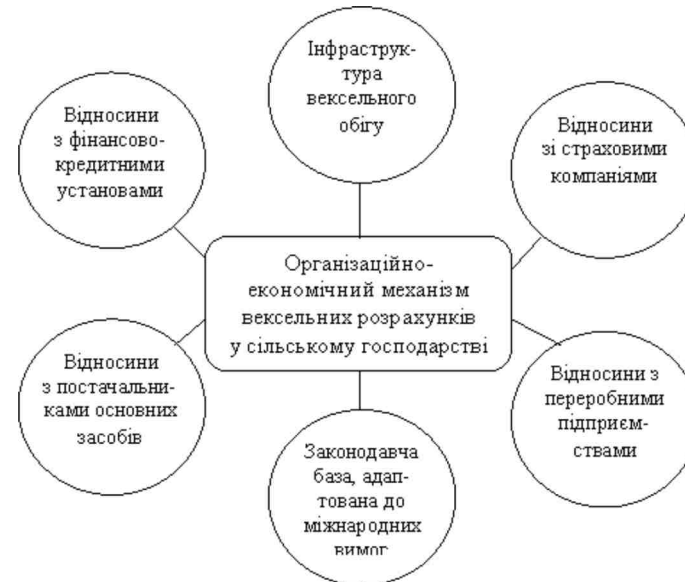
Рис. 1. Організаційно-економічний механізм вексельних розрахунків в сільському господарстві

Враховуючи зазначене, ключовими елементами організаційно-економічного механізму вексельних розрахунків у сільському господарстві є: розвинена інфраструктура вексельного обігу, паритетні відносини з фінансово-кредитними установами та страховими компаніями, вексельні відносини з контрагентами сільськогосподарських підприємств (в тому числі, з постачальниками основних засобів виробництва – техніки, паливно-мастильних матеріалів, добрив, засобів захисту рослин, ветеринарних препаратів тощо; з підприємствами харчової та переробної промисловості), а також законодавчу базу, адаптовану до вимог міжнародного вексельного права.