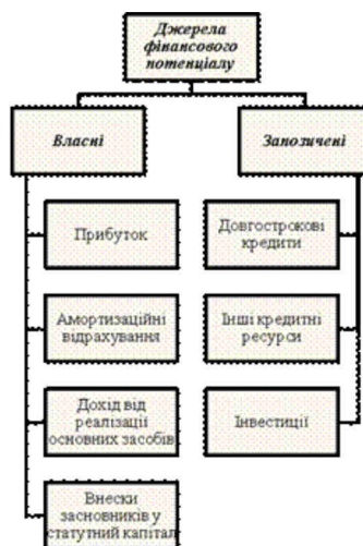
Рис. 2. Джерела фінансового потенціалу

Фінансовий потенціал будівельних підприємств, як і інших формується за рахунок власних та запозичених коштів. З точки зору джерел формування їх поділяють на внутрішні та зовнішні. На нашу думку доцільно виділити наступні джерела формування фінансового потенціалу підприємства: та представити їх взаємозв'язок на рис. 2.