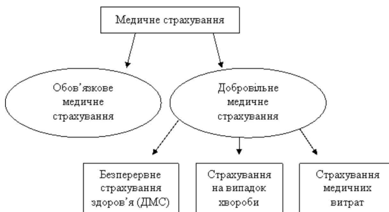
Рис. 1. Структура медичного страхування в Україні

Виділяють дві основні форми медичного страхування: обов'язкове та добровільне медичне страхування (рис. 1):