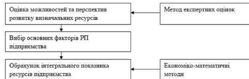
Рис. 1. Методично-практичні положення щодо оцінки ресурсного потенціалу підприємства

Оцінка рівня ресурсного потенціалу також потребує визначення умов, в яких здійснюється певний вид економічної або господарської діяльності підприємства. Методико-практичні положення щодо оцінки ресурсного потенціалу підприємства повинні базуватись на (див. рис.1):