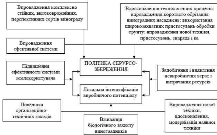
Рис. 1. Напрямок політики локальної інтенсифікації виноградарсько-виноробного виробництва [1, с 99]

Обов'язковою політикою локальної інтенсифікації в умовах економічного впливу на стабілізацію галузі, є впровадження ефективних економічних механізмів господарювання, які ґрунтуються на потенціал наявних принципах локальної інтенсифікації. Дані економічні процеси в свою чергу мають потребу в ефективному формуванні і функціонуванні безліччю факторів таких як: природних; організаційні; технологічних; економічних, а так само соціально-економічних.