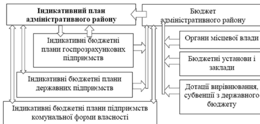
Рис. 2. Взаємозв'язок бюджетних планів підприємств і бюджету з індикативним планом СЕР АР

Отже, при визначенні очікуваних значень індикаторів цілі, що характеризують діяльність підприємств і бюджет району, необхідно консолідувати індикативні бюджетні плани державних, комунальних і госпрозрахункових підприємств, а також включити основні показники проекту бюджету району (рис. 2).