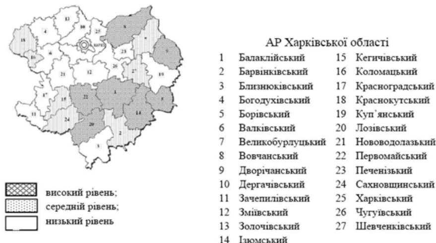
Рис. 1. Розподіл АР АРК за рівнем соціальної напруженості в 2013 р.

На рисунку 1 показано розподіл адміністративних районів Харківського регіону за рівнем соціальної напруженості, який побудовано на підставі значень інтегрального індексу (1).