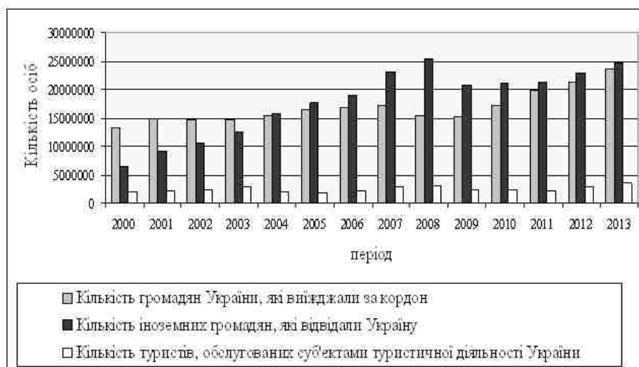
Рис. 1. Динаміка міграційних потоків України за 2000-2013 рр.

Як показано на рисунку 1, позитивні темпи змін і відповідна частка туристів у загальній кількості мігрантів зовсім незначні. Тобто діяльність туристичної галузі не є настільки привабливою, а саме не відповідає тому потенціалу, яким володіє Україна.