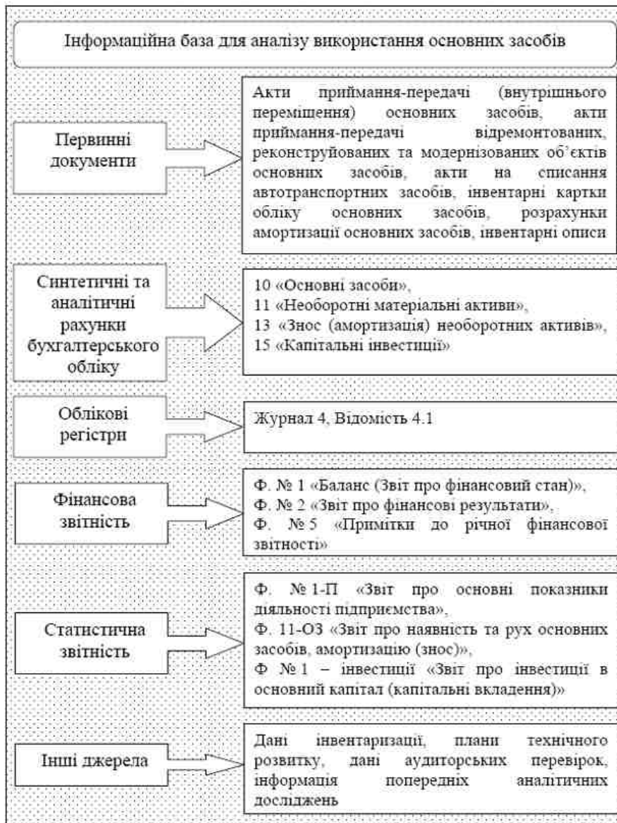
Рис. 3. Інформаційна база для аналізу процесу використання основних засобів

На третьому аналітичному етапі слід здійснювати аналітичну обробку інформації за допомогою спеціальних методів і прийомів, за допомогою яких здійснюється приведення показників у порівняльний вигляд, складання аналітичних розрахунків і таблиць.