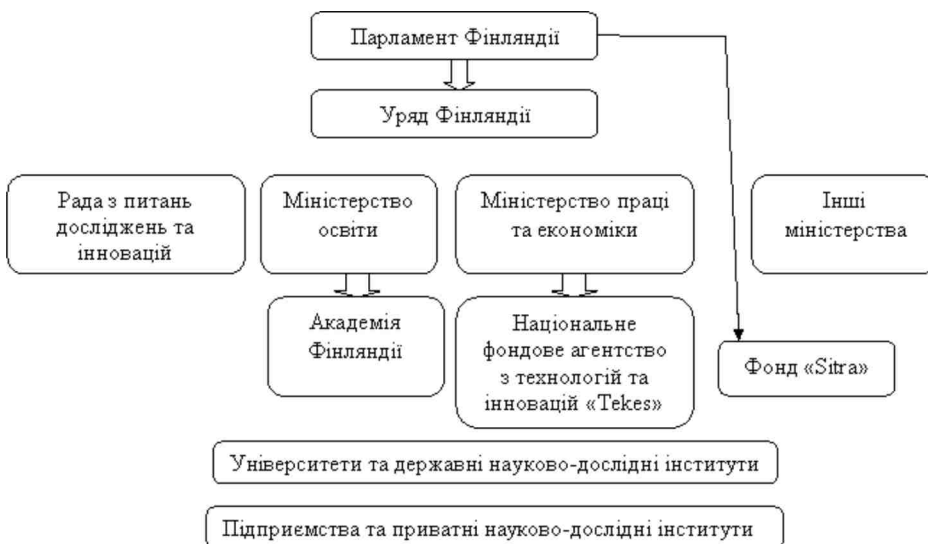
Рис. 2. Інституційна структура забезпечення інноваційної діяльності у Фінляндії [2].

Варто відзначити такі особливості та сильні сторони фінської інноваційної системи: стабільність систем освіти, управління та інститутів інноваційної діяльності, співпраця університетів та приватного сектору, наявність ринку венчурного капіталу та регіональних програм розвитку (див. рис. 2).