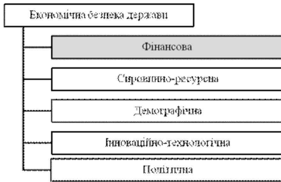
Рисунок 2. Основні складові економічної безпеки держави (складено автором)

Перелічені складові тісно пов'язані між собою, із внутрішнім та зовнішнім середовищем. А їх зв'язки мають як прямі так і опосередковані. В рамках цих видів у державі обираються цілі, задачі, а так же визначають пріоритетні з них. В результаті чого виникає конфлікт інтересів при розподіленні ресурсів, реалізації цілей.