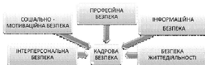
Рисунок 2. Складові кадрової безпеки

Проаналізувавши роботи науковців в галузі кадрової безпеки, авторка пропонує означити основними складовими кадрової безпеки зображено на рисунку 2.