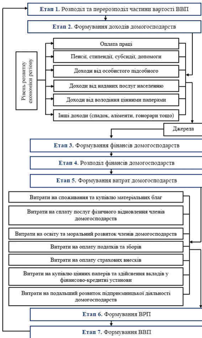
Рис. 1. Процес формування фінансів домогосподарств та їх вплив на ВРП та ВВП