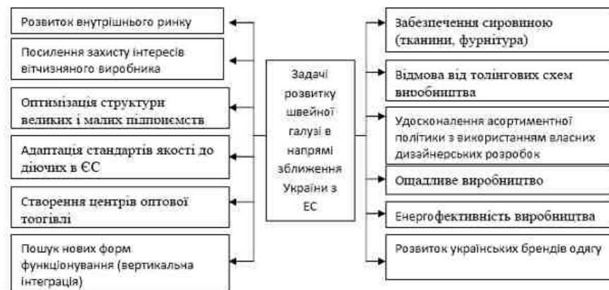
Рис. 2. Основні задачі щодо розвитку швейної галузі в напрямі зближення України з ЄС

Для вирішення поставлених задач необхідні інвестиції. Основними напрямками інвестування у швейну промисловість України: 1) вертикальна інтеграція; 2) модернізація, переоснащення, реконструкція підприємств; 3) впровадження нових технологій виробництва.