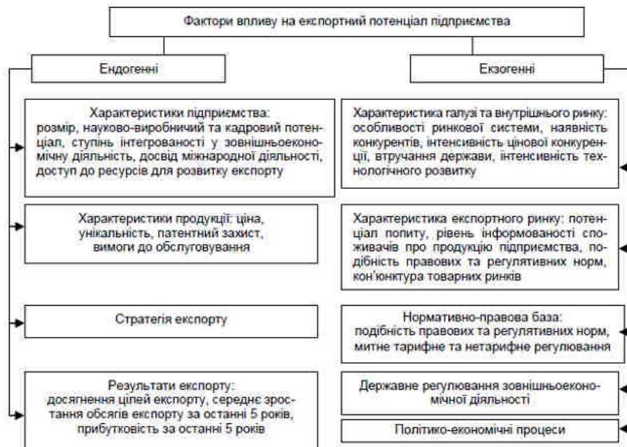
Рис. 1. Фактори впливу на експортний потенціал підприємства

Науковці пропонують виокремити дві групи факторів залежно від ступеня контролю над ними [14, с. 31]: ендогенні – пов'язані з діяльністю підприємства, його зовнішньоекономічною маркетинговою стратегією, характеристиками менеджменту; екзогенні – включають характеристики політичного, географічного, природнокліматичного середовища внутрішнього та експортного ринку (рис. 1).