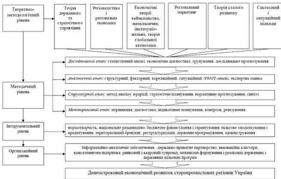
Рис. 1. Концептуальні положення державного регулювання довгострокового економічного розвитку старопромислових регіонів України

У процесі державного регулювання розвитку економіки регіону необхідно виділити чотири загальних етапи: